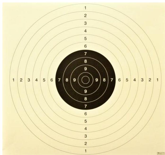
Rysunek 2-2. Nalepka tarczowa nr 23p/2 (2 razy zmniejszona).